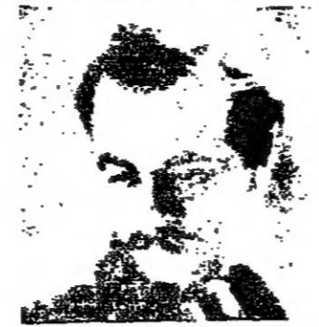
جبران خليل جبران : هل ارضعه ؟

تصق لكل ما يلينا من المغرب حتى اذا كان قاتلا للضخامة الانسانية